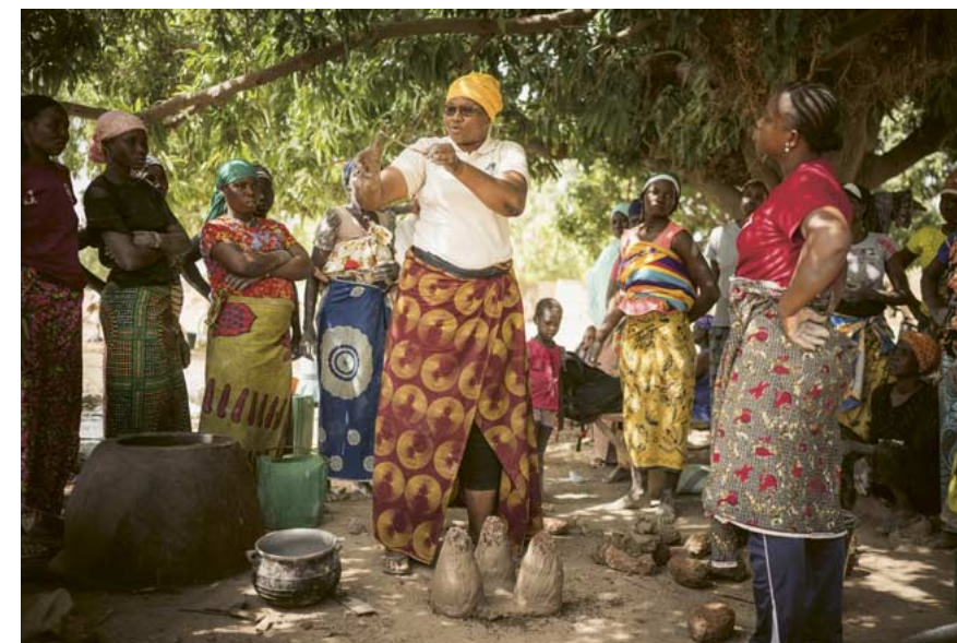
Eine Auszubildende von tiipaalga zeigt, wie man mit den Händen den optimalen Abstand zwischen Topf und Kochstelle ausmisst.

Seit Beginn wird der grösste Teil der Stromversorgung durch Solarpanels abgedeckt. Zur Sicherung der Stromversorgung in der Nacht wird das Zentrum an das städtische Netz angeschlossen. Weitere Informationen und Bilder: newtree.org/gampela