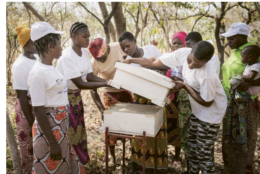
Junge Frauen auf dem Weg zur Imkerin. Sie schliessen die Ausbildung mit einem staatlich anerkannten Diplom ab.

Trotz Herausforderungen konnte Jura-Afrique Bénin viel bewirken, richtete sich strategisch aus und liegt innerhalb der Zielsetzungen des Mehrjahresplanes.